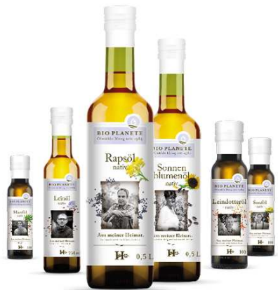
Absatzzahlen 2016 - 2020